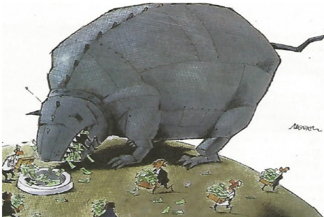
Immer mehr Geld für Rüstung und Krieg für „Frieden und Sicherheit“ (Karikatur: Publik-Forum 17/14)

In den letzten Monaten sind auf der Welt die Konflikte und kriegerischen Auseinandersetzungen rasant angestiegen.